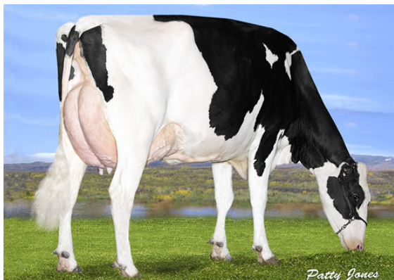
OCD DELTA MISSY DAM